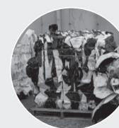
Bâches et sacs silos pour ensilage