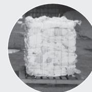
Pellicules de plastique pour balles d'ensilage