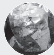
Bâches et sacs silos pour ensilage