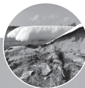
Sacs silos pour ensilage